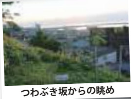
つわぶき坂からの眺め

〒940-2502 新潟県長岡市寺泊大町 9353-527 寺泊観光協会 TEL.0258-75-3363 月～日 / 8:30～17:00 ホームページ https://www.teradomari-kankou.com